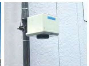
▲電源収納ボックス部分